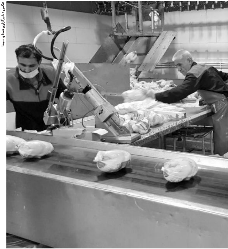
تکمیل: شیرگران صدا و سیما