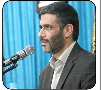
تاکنون مناطق آزاد، حیاط خلوت دولت‌ها و افراد خاص بوده است