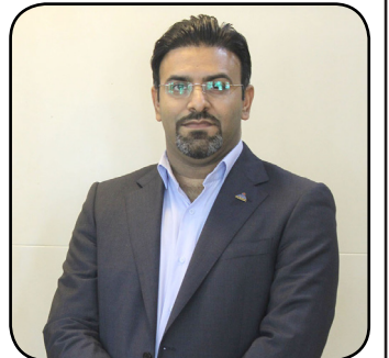
تأسیسات گازی شرکت گاز هرمزگان در سلامت کامل است