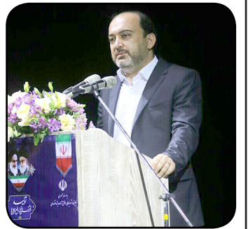
برای رفع مدیریت دوگانه در قشم تلاش می کنیم