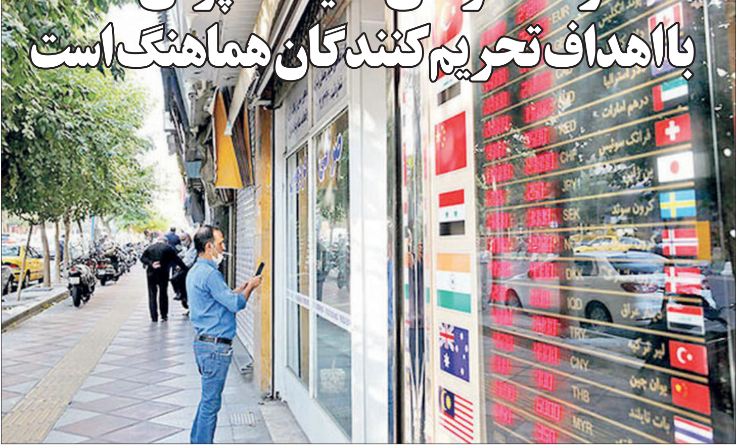
مکتب: اقتصاد آنلاین