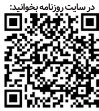
در سایت روزنامه بخوانید:

صندوق بین المللی در ماه دسامبر ۲۰۲۱(ژو۰۱۴۰) هشدار داد به دلیل شیوع سویه جدید کرونا عدد پیش‌بینی شده خود برای رشد اقتصاد جهانی را به میزان ۴/۹ درصد برای سال آینده کاهش خواهد داد.