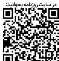
در سایت روزنامه بخوانید:

کمیسیون ملی حمایت از زندگی و اطلاعات خصوصی فرانسویان گوگل و فیس بوک را به ترتیب به جریمه‌های سنگین ۱۵۰ میلیون و ۶۰میلیون یورویی به دلیل نحوه عملکرد نادرستان خود در کوکی‌ها محکوم کرد.