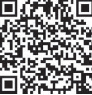
در سایت روزنامه بخوانید:

تنظیم‌کننده تجارت جهانی تصمیمی را در مورد اقدامات متقابل تعرفه‌ای چین علیه ایالات متحده صادر کرده است.