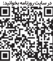
در سایت روزنامه بخوانید:

«امکان خرید خدمت در بودجه ۱۴۰۱ برای غائبان خدمت سربازی فراهم شد» این تیتُر خبری بود که مجری خبر سراسری شبکه یک سیما اعلام کرد و پس از آن به تشریح مبالغ و چگونه خرید خدمت برای مشمولان پرداخت که تاگاه صدای کودک ۱۰ ساله خانه ما بلند شد و گفت چرا برعکس؟ بله درست متوجه شدید یک کودک ۱۰ ساله نیز متوجه می‌شود که باید محصلان علم مورد تشویق قرار گیرند نه تنبیه؟ و سیاستمداران باید راهگشای جامعه برای تحصیل علم و کسب دانش باشند با این همه به نظر می‌رسد، مصوبه کمیسیون تلفیق برای خرید خدمت سربازی دقیقاً شیبور را از سر گشاد ان می‌نوازد یعنی افراد تحصیلکرده را جریمه و افراد دارای مدارک پایین را که از خدمت سربازی فراری بوده‌اند تشویق می‌کند به این معنی که هم درس بخوانی و عمر و مال خود را در راه تحصیل علم صرف کنی هم چوب بخوری. از نگاهی دیگر جمله معروف «علم بهتر است یا ثروت؟» عملاً با این سیاست‌گذاری آقایان کاربردی ندارد؛ زیرا از همان کودک ۱۰ ساله هم بپرسید مطمئناً جواب خواهد داد ثروت! آری پاسخ روشن است وقتی که پولداران بی سواد بسیار راحت می‌توانند با پرداخت پول از مشقت دو سال خدمت مقدس سربازی بگریزند و با گرفتن پاسپورت در سواحل قناری به ریش دکتریای بخندند که روزها و ساعت‌های بسیاری بی‌خوابی کشیده‌اند تا بتوانند از سد کشورهای متعدد عبور کنند و امروز در پادگان‌ها منتظر تمام شدن خدمت خود هستند. مشخص است که دیگر نمی‌توان به کودک ۱۰ ساله نوشتار ما قیولند که علم