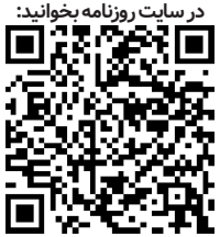
در سایت روزنامه بختوانید:

پدر مرحومم هر وقت می‌خواست من را به تصمیم‌گیری دوراندیشانه و بلند مدت دعوت کند می‌گفت: یک نفر که سنگ در چاه می‌اندازد که صدنفر عاقل نمی‌توانند آن را در دیابورند.