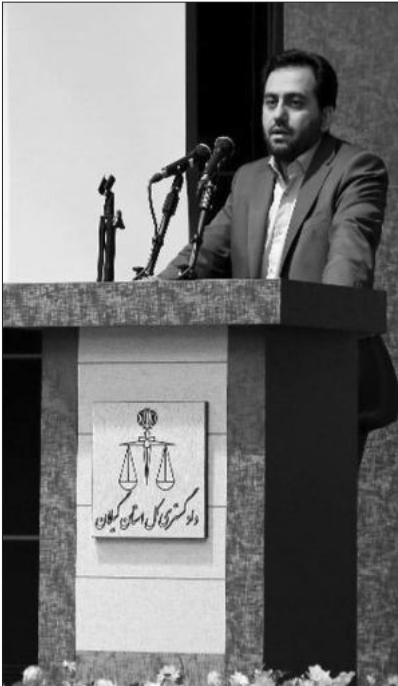
مدیرعامل بنیاد برکت از ایجاد اشتغال این