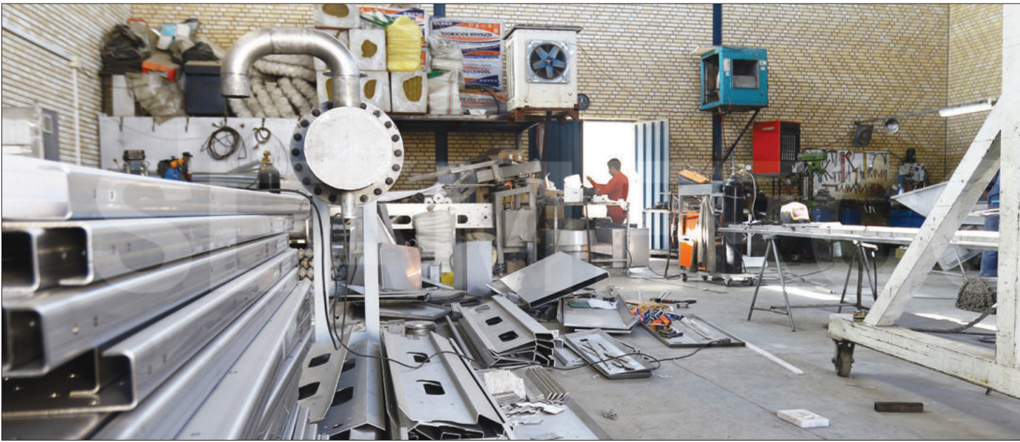
یک کارخانه تولید فولاد در چین

مصر در آخرین مناقصه گندم روز چهارشنبه یک محموله بزرگ گندم از روسیه رزرو کرد، در حالی که بیشتر خریدهای دیگر توسط فرانسه صورت گرفته است.