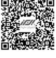
در سایت روزنامه بخوانید:

TUV Intercert به عنوان یکی از معتبرترین شرکت‌های فعال در این زمینه کمک گرفته و برای چندمین سال متوالی موفق به تمدید گواهی نامه های مدیریت یکپارچه در سری استانداردهایISO۱۰۰۰۴ و ISO ۱۰۰۰۲ شد که به معنای بهبود در سطح عملکرد و فعالیت های بیمه البرز است. وی تاکید کرد: امیدواریم هرروز شاهد پیشرفت در اجرای صحیح فرآیندها و افزایش هرچه بیشتر رضایت مشتریان، به عنوان یکی از ارکان اصلی ماموریت بیمه البرز باشیم.