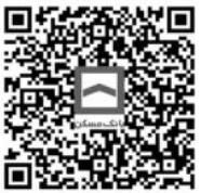
در سایت روزنامه بخوانید:

خبری بانک مسکن، در جدیدترین به‌روزرسانی سرویس کارت به کارت این اپلیکیشن، بانک مسکن هم به بانک‌های مبدا اضافه شده است. آمارهای گزارش سالانه دیجی‌پی نشان می‌دهد که سال گذشته سرویس کارت به کارت، پرتیراوترترین سرویس در این اپلیکیشن بوده است.