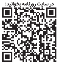
گردآوری و ترجمه: حسین سلطانی مطلق