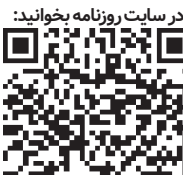
زنگ خطر به صورت جدی در مورد انرژی‌های