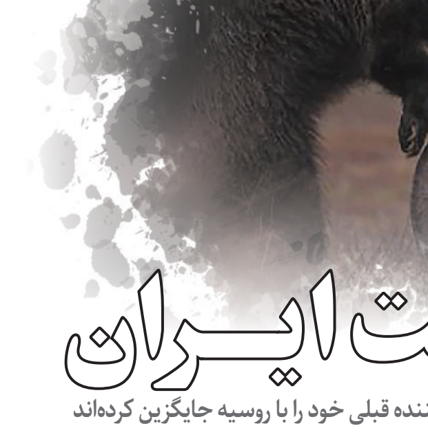
طرح : فاطمه بزدانی . عصر اقتصاد

این بازارها پیش از این توسط صادرکنندگان دیگر تأمین می‌شد که ایران نیز یکی از آنها بود و حال با قدرت نمایي خرس بزرگ در بازاریابی، رقبا جای خود را به نفت روسیه داده اند. در این بین می توان به مساله ای اشاره کرد که در ابتدای مطلب به آن اشاره شد و آن نیز تصدی دولتی صنعت نفت است. تصدی دولتی صنعت نفت هیچ گاه به ایران اجازه نداده که شیوه های جدید بازاریابی برای صادرات کامودیتی را فرا گیرد؛ چرا که صنعت نفت کشور به تعدادی مشتری سنتی وابسته است و اگر در این بین یک تأمین کننده جدید با چند پیشنهاد مدرن به میان بیاید، مشتری مبدی به سادگی مجاب خواهد شد که نفت ایران را از لیست تأمین کنندگان خود حذف کند. ناگفته نماند که بسیاری از مشتریان نفت ایران به واسطه تخفیف‌های مطلوب و درجه سنگینی نفت مورد نظر خود نفت ایران را خریداری می کنند و در شرایط تحریم های بین المللی و عدم ثبات در اقتصاد، بیشتر واردکنندگان نفت ترجیح می‌دهند که ریسک‌های خرید نفت از ایران را متحمل نشوند. از این رو وجود یک گزینه جایگزین با پیشنهادات قابل توجه می تواند به سادگی بازار را از چنگ ایران خارج کند.