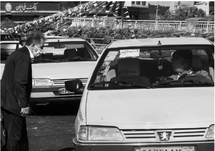
تاکسی‌های تهران در حال حاضر به واسطه کمبود سوخت و افزایش قیمت بنزین، کمترین سوخت را دریافت می‌کنند.

فعالیت در خطوط جذابیت چندانی ندارد، گفت: مثلا کرایه تاکسی میدان ونک تا صادقیه حدود ۱۲۰۰۰ تومان است و اگر یک راننده سه یا چهار نفر سوار کند نهایت درآمدش از این سفر ۳۶۰۰۰ یا ۴۸۰۰۰ تومان می شود ولی همان موقع یک راننده مسافری اینترنتی، از ونک تا محدوده صادقیه را در پیک ترافیک با حدود۱۰۰.۰۰۰