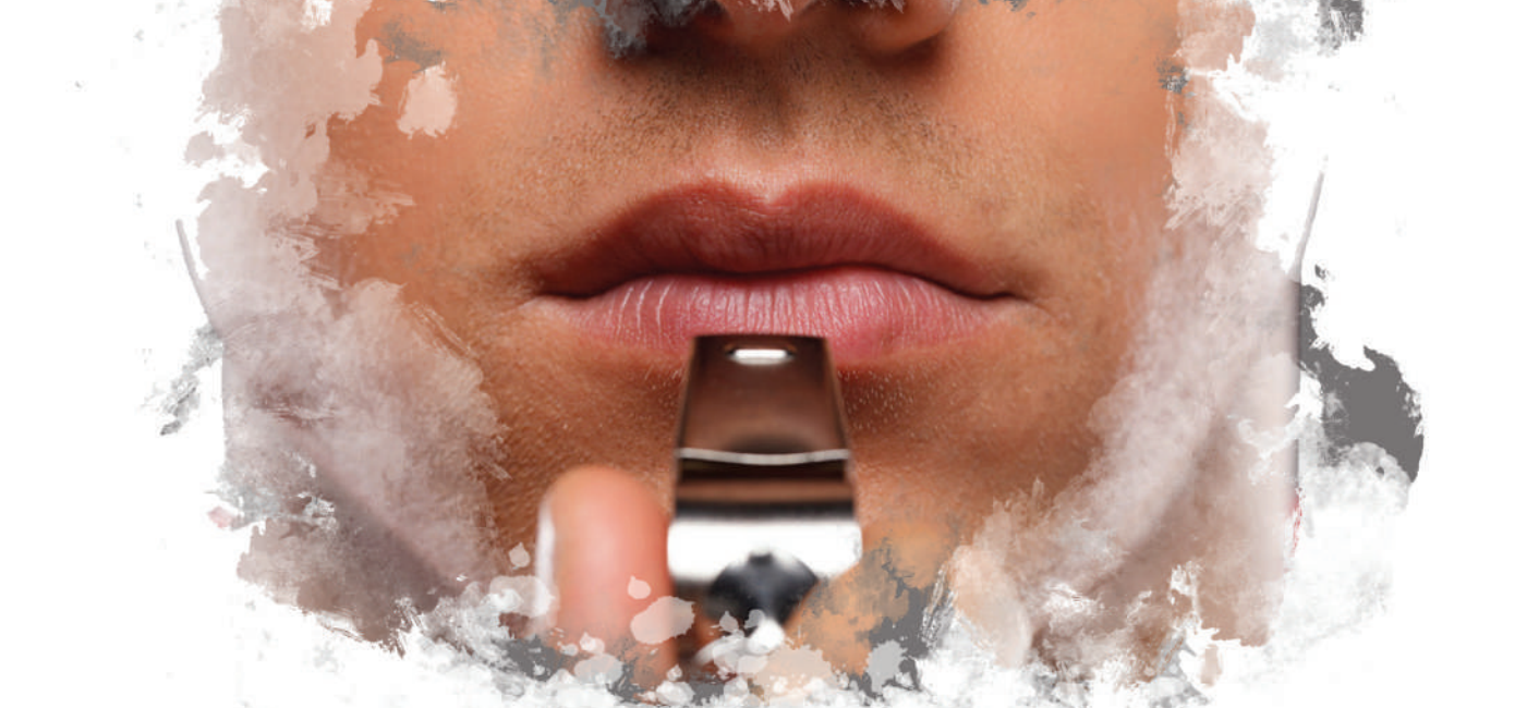
طرح : فاطمه یزدانی . عصر اقتصاد