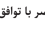
ترجمه: محمود نواف مطلق

وزرای خارجه مصر و یونان روزیکشنبه ۹ اکتبر(۱۷مهر) امضای تفاهم اکتشاف ذخایر هیدروکربور(نفت) در آب‌های لیبی را میان دولت لیبی و ترکیه در هفته گذشته غیرقانونی خواندند. این تفاهم نامه سه سال پس از توافقنامه بحث برانگیز تجدید حدود دریایی به امضاء رسید.