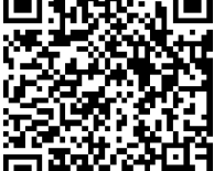
در سایت روزنامه بخوانید:

میزان تبدیل مزارع کشاورزی به انواع ارگانیک آن به نحو بی سابقه‌ای کاهش یافته‌است.