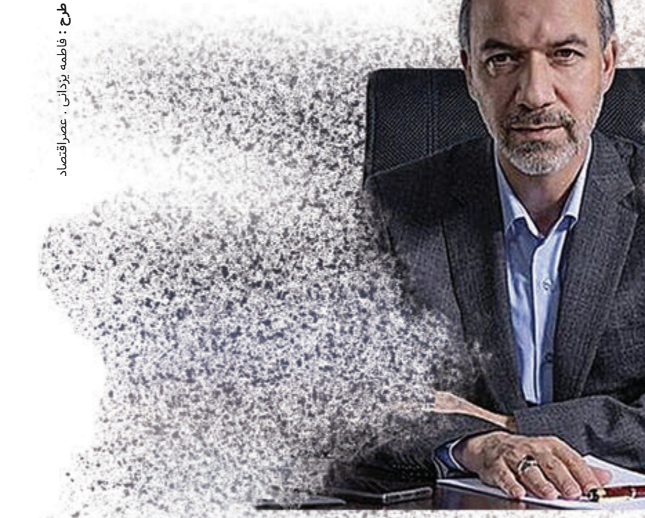
وزیر نیرو، هوارزاق، در جریان دیدار با مدیرعامل شرکت نیروگاه‌های خورشیدی، در تهران.