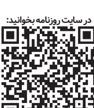
در سایت روزنامه بخوانید:

نرخ بیکاری در آمریکا در ماه اکتبر(مهر) کمی افزایش یافت و به ۳٫۷درصد رسید. در همین زمان میزان اشتغال‌زایی از حد پیش‌بینی شده نیز فراتر رفت و به رقم ۲۶۱هزار شغل رسید.