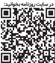
در سایت روزنامه بخوانید:

«کلیمان پُن» وزیر حمل و نقل فرانسه روز یکشنبه ۱۶نوامبر(۱۵آبان) در مصاحبه با نشریه فیگارو حمایت خود را از گنجانده شدن یک بند بازنگری در سال ۲۰۲۶(۱۴۰۵) درباره ممنوعیت فروش خودروهای نو گرمایشی و دوگانه سوخت برقی-بنزینی تا سال ۲۰۳۵(۱۴۱۴) در اتحادیه اروپا اعلام کرد.