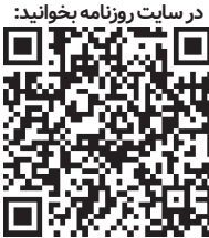
در سایت روزنامه بخوانید:

این شرکت ۲٫۲ میلیارد دلار در پروژه‌های اکتشاف لیتیوم در آرژانتین سرمایه‌گذاری خواهد کرد.