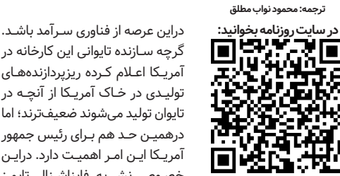
ترجمه: محمود نواب ملطق

ریزپردازنده‌ها به عنوان مهمترین پیش‌نیاز تجهیزات مهم الکترونیکی در زمینه‌های گوناگونی چون هوش مصنوعی، محاسبات کوانتومی و همچنین تولید تجهیزات نظامی فوق حساس محسوب می‌شوند. آمریکا در این مورد به دو نکته باید بیندیشد: هم به فکر تأمین نیازهایش باشد و هم