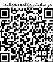
در سایت روزنامه بخوانید:

بنا به گفته بانک‌مرکزی اروپا دستمزدها در کوتاه مدت برای مقابله با تورم افزایش چشمگیری خواهند یافت.