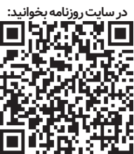
در سایت روزنامه بخوانید:

تقاضا قیمت‌های ترکیب ESPO کم گوگرد روسیه را که توسط پالایشگاه‌های هندی خریداری می‌شود، به بالاتر از سقف ۶۰ دلار در هر بشکه تعیین‌شده توسط کشورهای GV برای نفت خام دریایی روسیه رسانده است. چین همچنین ESPO را در بالاتر از سقف قیمت تعیین شده متحران غربی از خرید خریداری کرده است. برای کاهش ریسک، واردکنندگان نفت روسیه از ازرهایی غیر از دلار