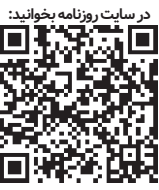
در سایت روزنامه بخوانید:

نوآوری و خلق ارزش افزوده دستاورد افتخارآمیز پرتوشیمی‌کارون زشت و زیبای اقتصادی سال ۱۴۰۱ جهش سودآوری تاسیکو در راه است گام های بلند گهر زمین به سوی بازارهای جهانی