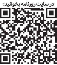
در سایت روزنامه بخوانید:

شرکت نفتی عربستان سعودی، آرامکو رکورد سود خود را معادل ۱۶میلیارد دلار در سال ۲۰۲۲ (۱۴۰۱) اعلام کرد. سودی که سه برابر سود شرکت آمریکایی اِکسون موبیل است و مقام اول سرمایه‌گذاری دربازار بورس را کسب کرده‌است.