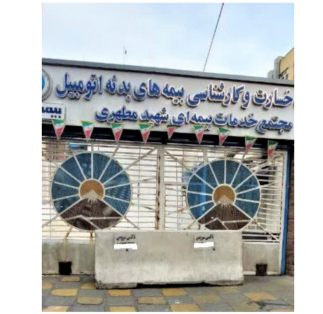
مقابل آن با بلوک سیمانی نموده است.

دکتر دستغیب در بخش دیگری از سخنان خود ضمن تأکید بر لزوم شفافیت هر چه بیشتر دستگاه ها در عرصه های مختلف، گفت: شفافیت یکی از ابزارهای مهم برای پیشبرد اهداف در مجموعه ها است که با بهره گیری از آن می‌توان به یوپایی بیشتر سازمان ها کمک کرد.