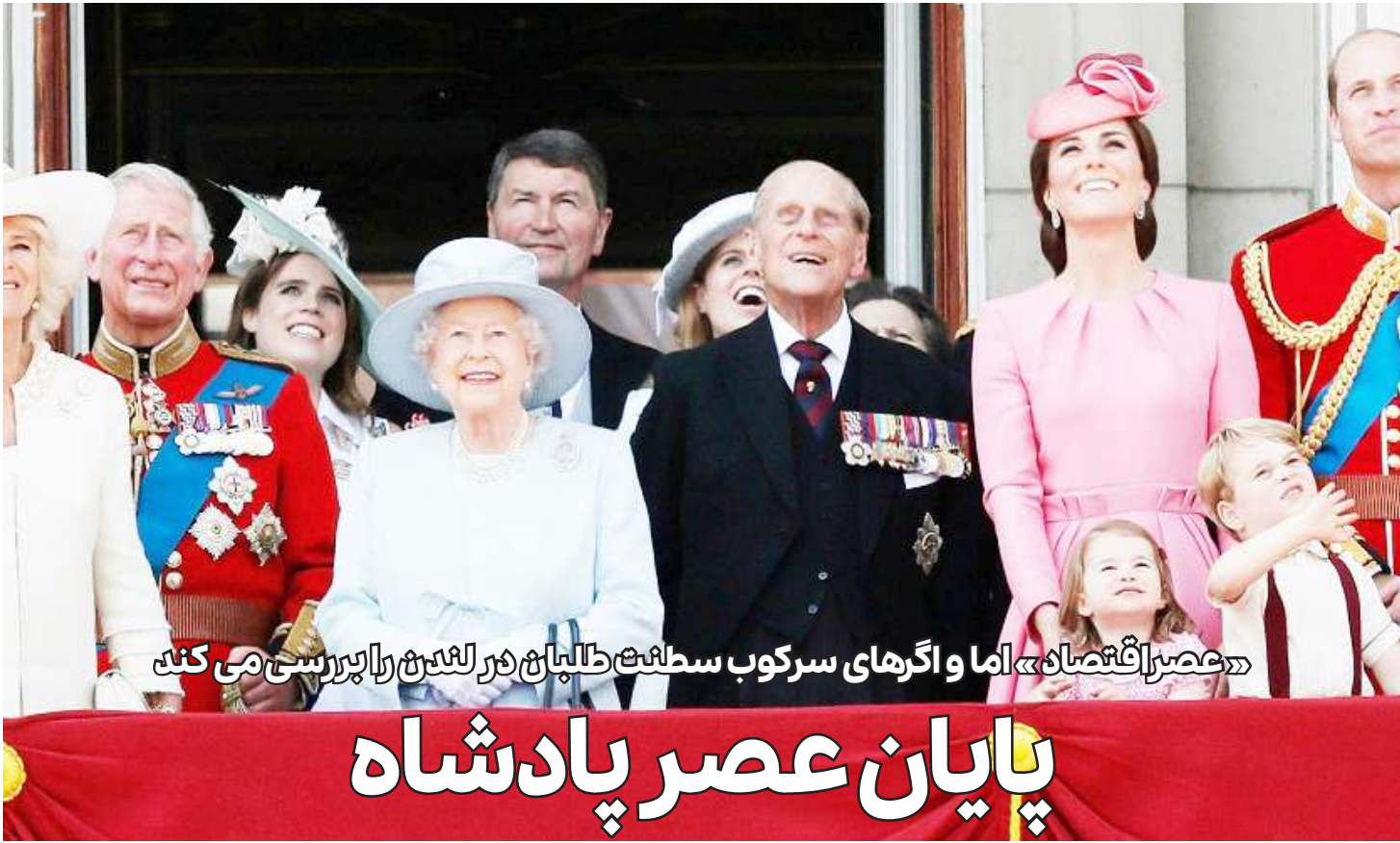
«عصراقتصاد» اما و اگرهای سرکوب سلطنت طالبان در لندن را بررسی می کند