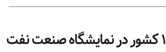
نمایانگر بخشی از نمایشگاه صنعت نفت

که مردم سیستان در اعتراض به عملکرد کمیساریای آب ایران نسبت به پیگیری حق آبه رودخانه هیرمند دست به تشکیل زنجیره انسانی در بستر تالاب هامون زدند. مشارکت‌کنندگان در این اقدام اعتراضی خواستار پیگیری کمیساریای آب ایران، وزارتخانه‌های نیرو و امورخارجه نسبت به حق آبه رودخانه هیرمند طبق معاهده ۱۳۵۱، حق آبه زیست محیطی تالاب بین‌المللی هامون، اصلاح سامانه انحرافی بند کمال‌خان و جلوگیری از تکمیل سد بخش‌آباد روی فرارود شدند.