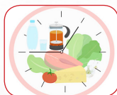
بیشگیری از افزایش وزن