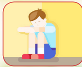
کاهش علائم افسردگی