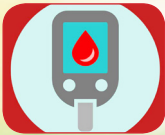
کاهش خطر دیابت