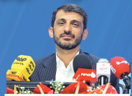
مدیرعامل گروه فولاد مبارکه در نشست خبری با خبرنگاران و اصحاب رسانه

سودآوری فولاد مبارکه به هیچ‌عنوان ناشی از رانت نیست و این یک تفکر انحرافی است که هر کس سود می‌دهد، از رانت بهره‌مند است. فولاد مبارکه از منابع ملی ارزش‌افزوده می‌آفریند.