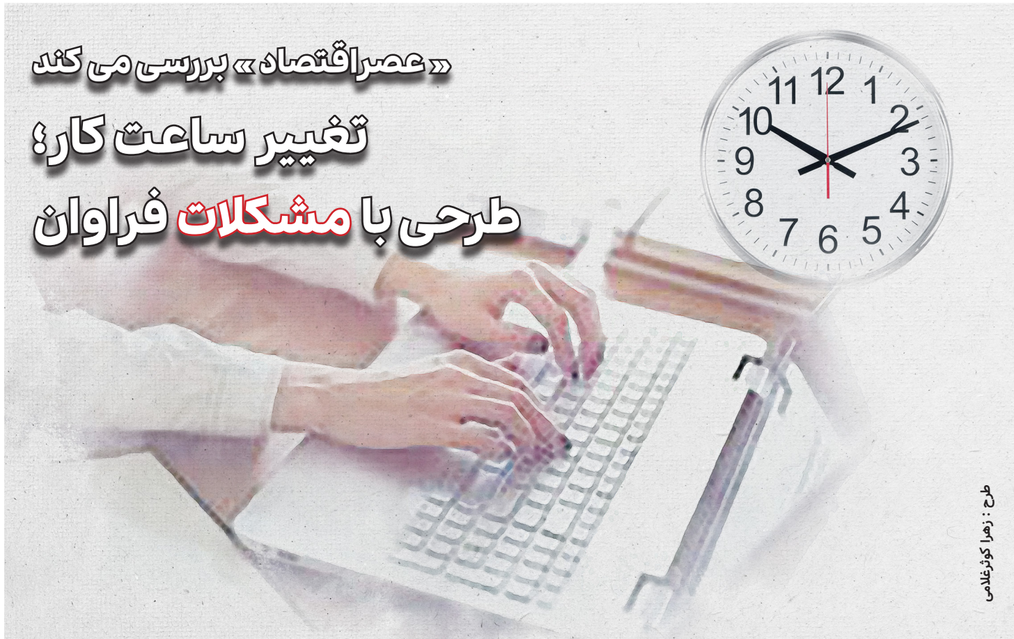
طرح : زهرا کوثرغلامی

کشوری، بانک‌ها، شهرداری‌ها و سایر نهادهای عمومی اعلام کرد که ساعت کار خدمت حضوری تمامی کارکنان خود و سایر افراد شاغل (اعم از رسمی، پیمانی، قراردادی، شرکتی و...) را حداکثر تا ساعت ۱۳ قرار داده و مابقی ساعات کار موظفی را از طریق دورکاری (با تهییدات لازم) جبران کنند. بخشنامه سازمان اداری و استخدامی کشور در راستای حفظ پایداری شبکه سراسری برق و کاهش ناترازی تولید و مصرف برق، با هدف آسایش شهروندان و عدم وقفه در خدمت‌رسانی، در اجرای بند ۴ اصلاحی تصویب‌نامه ۲۸ اسفند ۱۴۰۱ هیئت وزیران صادر شده است.