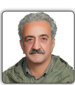
دکتر یونسفامرز، مدیرکل بازرسی و نظارت بر صنایع غذایی

هم یکی از سرفصل های این مدیریت گل و بلبل است که درست موعه‌ی که هیچکس به خواب نبود اتفاق افتاد. تدبیر مشعلانه ای که یک صبح به ظهر نرسیده از کیسه مارگری عقالی طاق و جفت اقتصادی کشور در آمد و شد همانچه که دوست داشتند بشود.