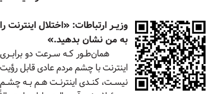
وزیر ارتباطات: «اختلال اینترنت را به من نشان بدهید.»

مشکل گیرنده دارد و دومی کاملاً طبیعی و بدون هیچ ایرادی است. در واقع چشم مسئولان طوری طراحی شده است که به محض رسیدن به مشکل، ناگهان قدرت بینایی خود را از دست می‌دهد و پس از گذر از بحران، دوباره مانند عقاب بینا می‌شود. شما اگر در کنار وزیر ارتباطات بنشینید، یک فیلم پنج دقیقه‌ای را در پنجاه و پنج دقیقه دانلود کنید و بگویید: «بفرمایید این هم مدرک کندی اینترنت. احتمالاً می‌گوید: «کو؟ پس چرا من هیچی ندیدم؟»