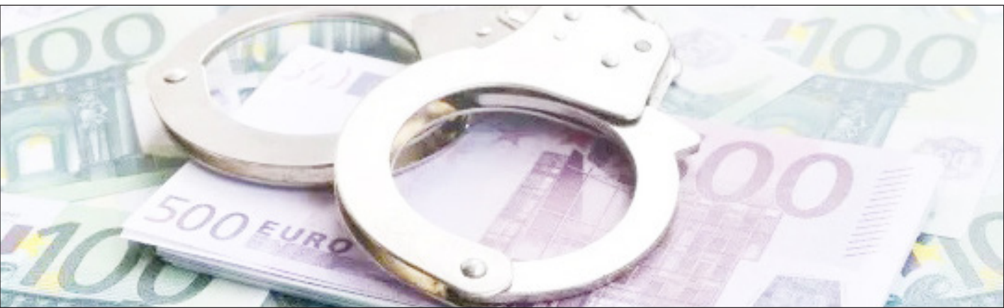
پولشویی از طریق حساب‌های بانکی