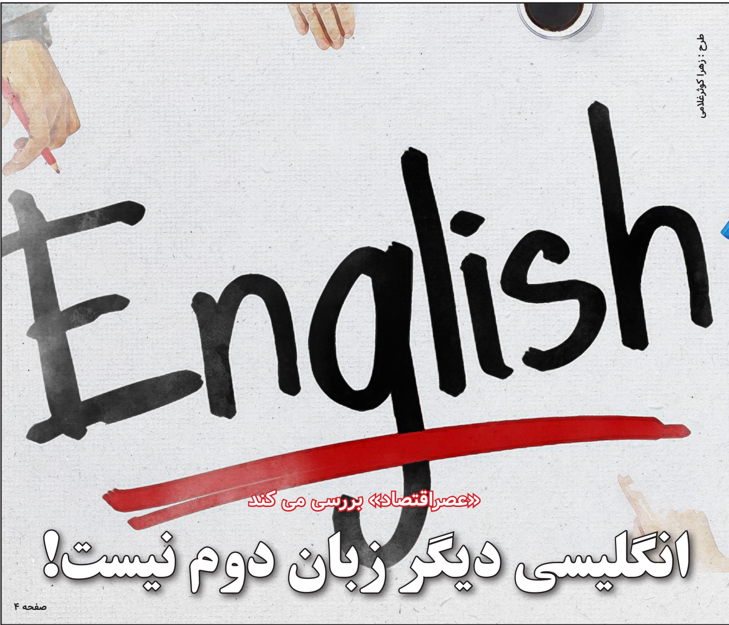
طرح: زهرا نورزاهایی