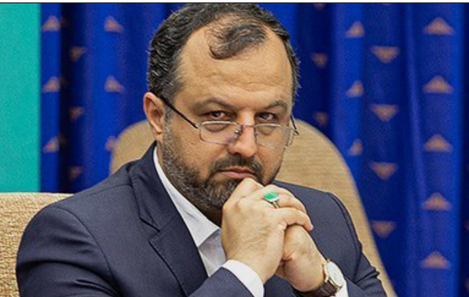
وزیر اقتصاد در جریان دیدار با مدیران بانک پاسارگاد

رفت از چنین وضعیتی سیستم اداری در واکنش به تکانه‌های ارزی نسبت به تغییر و مقررات ارزی روی می‌آورد که ممکن است با واقعیت‌های موجود در بطن تجارت همخوانی نداشته باشد و در نهایت