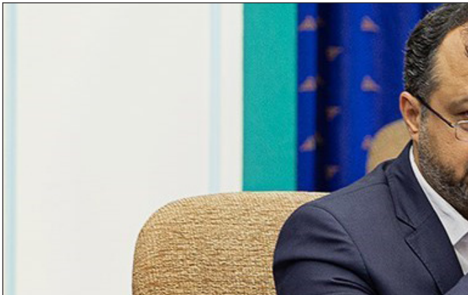
وزیر اقتصاد در جریان دیدار با مدیران بانک پاسارگاد

این است که چه چیزی بلد هستیید. این مسئله را در مدارس عالی مختلف به افراد آموزش می‌دهند. باید بتوانیم با دوره‌هایی که برگزار می‌کنیم جای خالی مدارس عالی را در نظام بانکی