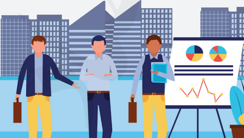
انتخاباتی عصر اقتصاد: رهبر کورنگی‌ها