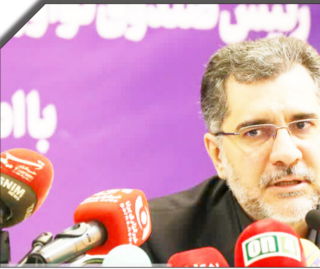
سهم شرکت‌های نوپای دانش‌بنیان باید به خوبی دیده شود؛ ما در صندوق، بسته رشد تولید محصولات دانش‌بنیان را طراحی کردیم تا به رشد تولید محصولات شرکت‌های دانش‌بنیان کمک کنیم.

وی اضافه کرد: بر اساس این برنامه ۱۰۰۰ شرکت دانش‌بنیان با تأمین مالی ۱۰ همتی منجر به رشد فروش ۱۰۰ همت می‌شوند و برای تحقق آن با ۴ بانک عامل توافق کردیم که با ۲ بانک نیز توافق آن امضاء شده است