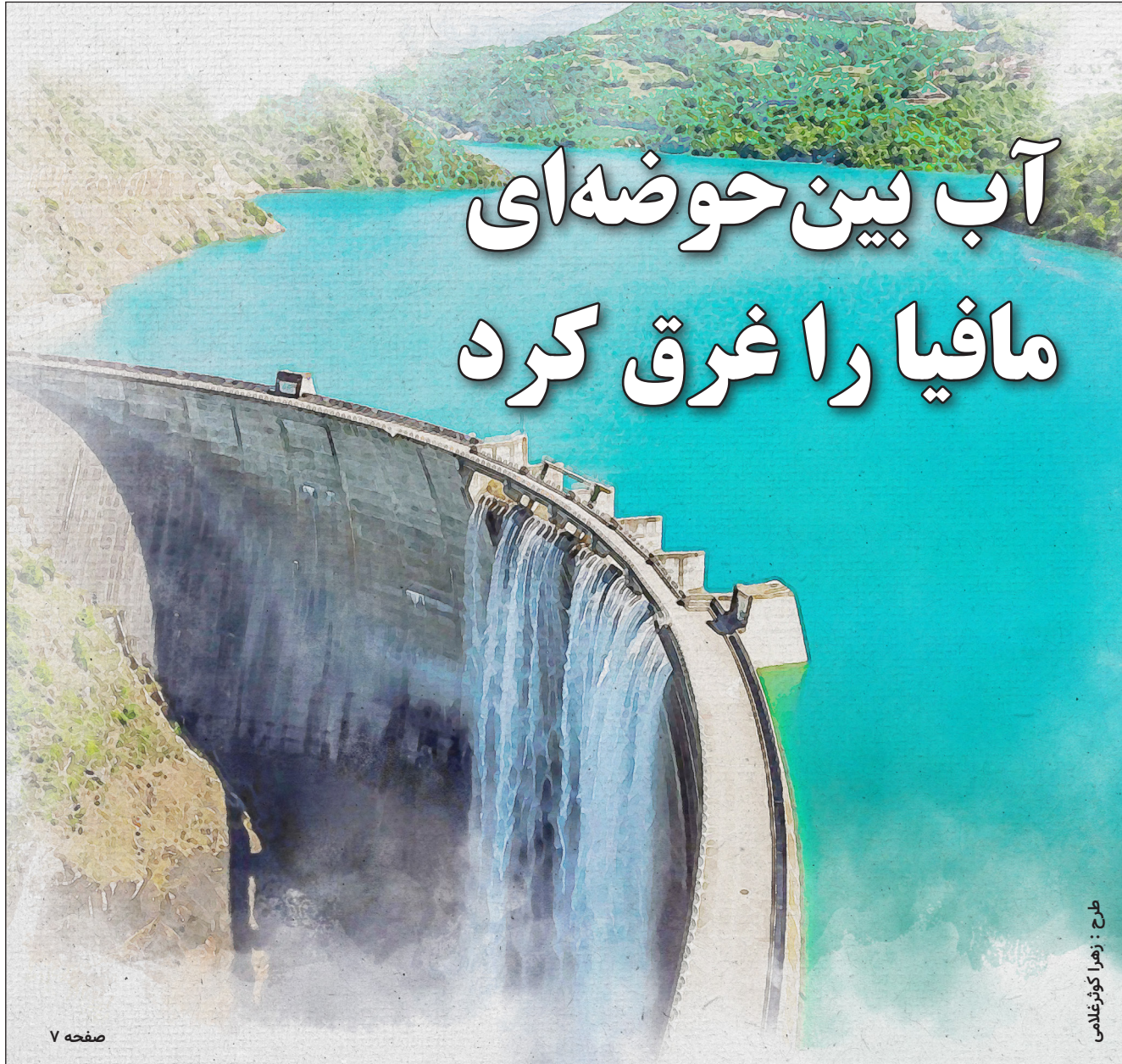
طرح : زهرا کورخلانی