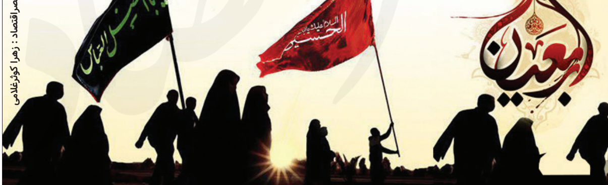
اختصاصی عصر اقتصاد: زهرا کوشغلامی