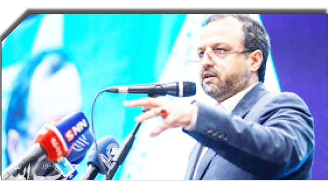
عاصراققتصاد: بنابر اعلام وزیر اقتصاد،

در یک سال و نیم گذشته روند مقابله با پولشویی سرعت گرفته که طی این مدت برای ۳۸ پرونده مقابله با پولشویی رای قطعی صادر شده است، همچنین ۶۰۰۰ شخص فاقد پرونده مالی شناسایی شدند که از این محل ۲۰ هزار میلیارد تومان ظرفیت مالیاتی ایجاد شد.