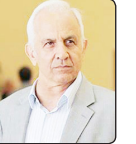
دکتر علینقی مشایخی موسس دانشکده مدیریت دانشگاه صنعتی شریف