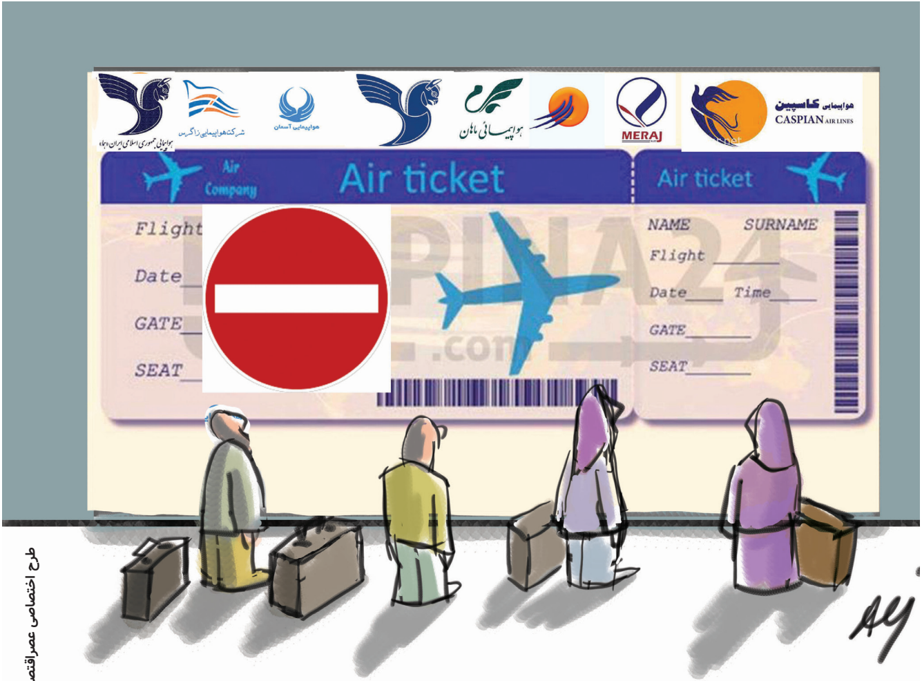
طرح اختصاصی عصر اقتصاد : علی قناعت