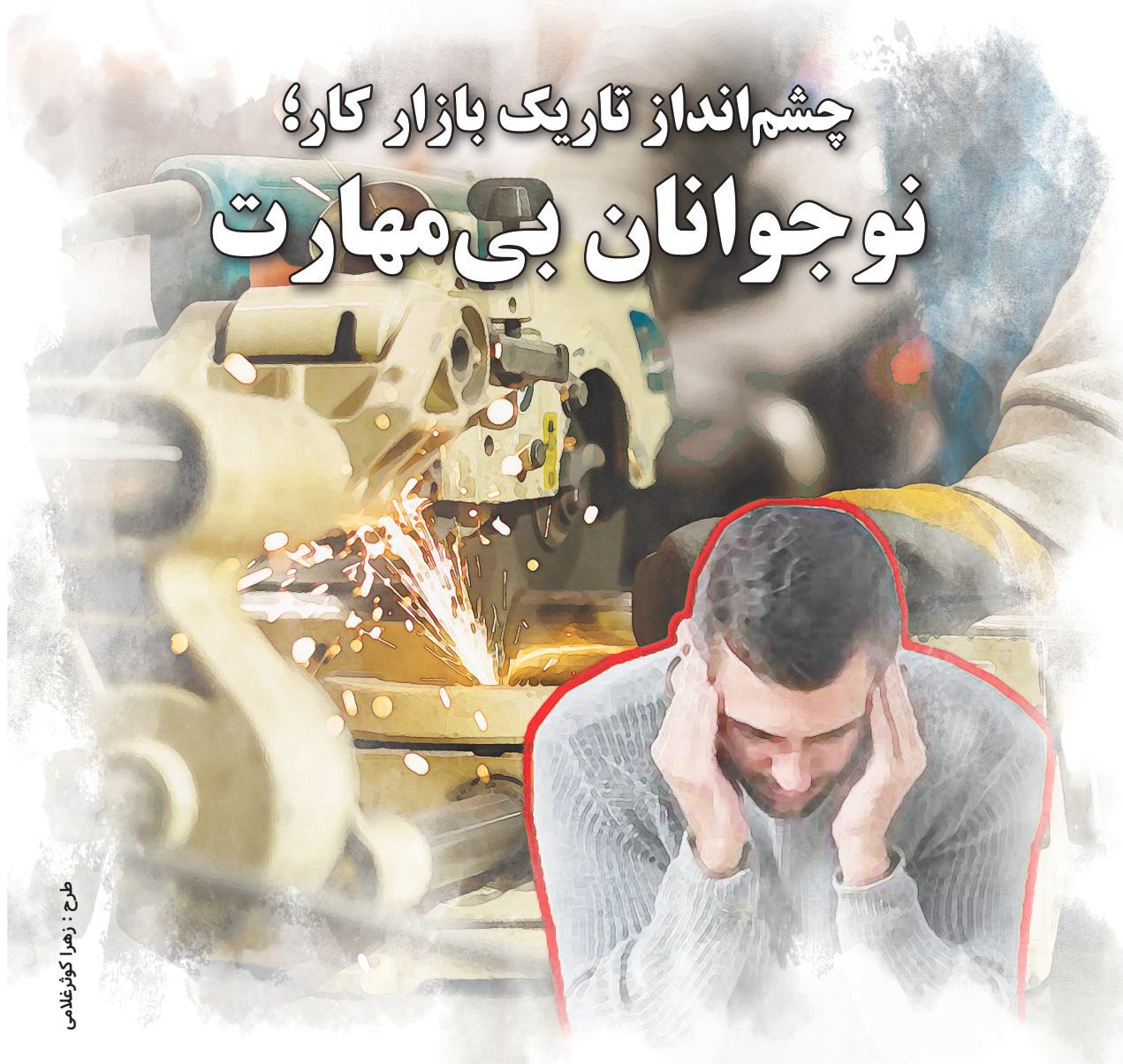
طرح : زهرا کورغانی