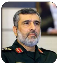
سردار حاجی زاده: