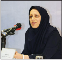
(کارشناس پژوهش دفترمطالعات و برنامه ریزی