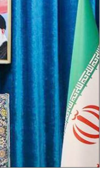
سردار سلیمانی در جریان سخنرانی

رئیس سازمان بسیج مستضعفین گفت: فلسطینیان در طوفان الاقصی توانستند رژیم صهیونیستی را متحمل یک شکست تمام عیار کنند و در این ۵۰ روز توانستند در عرصه زمینی نیز این رژیم را شکست دهند؛ همچنین با شکست غول‌های رسانه‌ای نشان دادند که این رژیم چقدر ظالم و غاصب است.