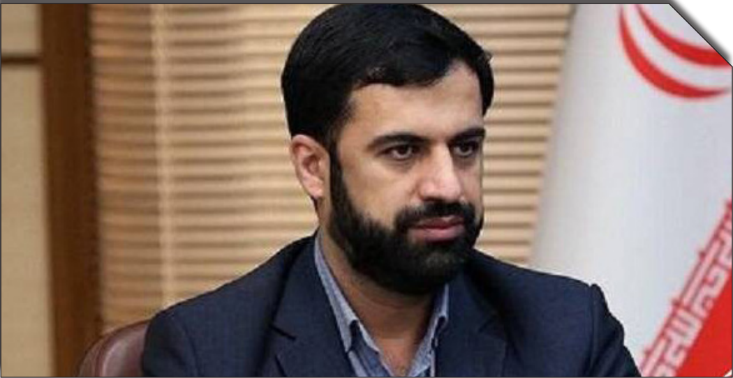
عصاره اقتصاد: به گفته قائم مقام وزیر