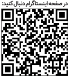
در صفحه اینستاگرام دنبال کنید

«یک تصمیم عجیب از کمیته‌ی اضطرار آلودگی هوا؛ دیشب تصمیم گرفتند که امروز تصمیم بگیرند.» از قدیم گفته‌اند که «از این ستون به اون ستون فرجه» در واقع افراد کمیته، وقتی دیدند کاری جز تعطیلی از دست‌شان برنی‌آید تصمیم گرفتند همه چیز را به صبح بعد موکول کنند، بلکه فرجی شد. مثلاً آسمان یک‌هو در روز بعد صاف، پاک و صیقلی شد. یا هفت صبح همه‌ی ماشین‌ها با فاسدان را موخر بر اصلاح سازوکارهایی می‌دانند که فساد پرور است. در ساز و کار حکمرانی خوب، برای مبارزه موثر با فساد مشارکت فعال شهروندان، تعهد جمعی به شفافیت، پاسخگویی حاکمیت قانون، نظارت اجزای مخالف و رسانه‌های آزاد، قاعده مندی در سیاست گذاری و... بسیار مهم است و این اقدامات گام‌های اساسی در راستای مهار فساد و ساختن جامعه‌ای عادلانه تر به شمار می‌روند.