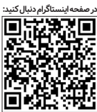
در صفحه اینستاگرام دنبال کنید

وی می گوید: پیتر سنکه در دو کتاب سازمان های یاد گیرنده و رقص تغییر عنوان می کند که سازمان ها باید مانند افراد توسعه بیابند و شروع تغییر هم باید از عذر خواهی باشد! عذر خواهی یا حواله به رشد بادمجان! به گزارش عصر اقتصاد در کتاب پنج زبان عذرخواهی نیز به این نکته کلیدی اشاره دارد که راز داشتن روابط سالم در یادگیری زبان عذرخواهی است و لذا اگر قرار است که مدیران اقتصادی تغییری در روال فعلی اقتصاد صورت بدهند نیاز به قبول اشتباهات است نه این که در هر دوره رقتن فرد تنها به این جمله بسنده شود که: « ویرانه ای را تحویل گرفته ایم و در دو سال اول همچنان با بولدوز در حال خاک برداری هستیم!» این که تنها مدیران به