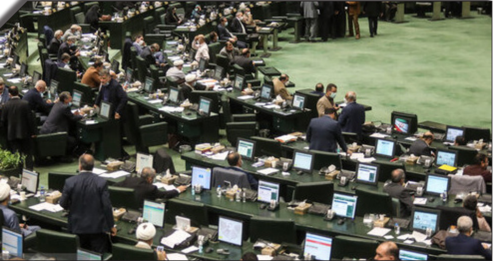
در صفحه اینستاگرام فعلی کنید