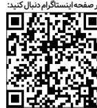
در صفحه اینستاگرام دنبال کنید

فساد یک مشکل جدی در ایران به شمار می رود که غالباً در سیستم حکومت گسترده و دامنه دار است. از دیدگاه سازمان شفافیت بین الملل ، ایران از نظر فساد در زمره یکی از فاسد ترین کشورهای جهان قرار دارد. براساس گزارش سال ۲۰۲۳ میلادی این سازمان ، ایران با رتبه ۱۴۷ رده فاسد ترین سیستم های اقتصادی دنیا و هم تراز با افغانستان و اوگاندا است. همگان پذیرفته اند که فساد هزینه های سنگینی برای توسعه اقتصادی دارد. شواهد نشان می دهد که سطوح بالاتر فساد با رشد کم تر و درآمد سرانه پایین مرتبط است. آسیب به توسعه پایدار اقتصادی، رده فاسد ترین سیستم های سنگینی برای توسعه اقتصادی دارد. شواهد نشان می دهد که سطوح بالاتر فساد با رشد کم تر و درآمد سرانه پایین مرتبط است. آسیب به توسعه پایدار اقتصادی، تنها پیامدهای فساد نیستند؛ این پدیده می‌تواند در عمیق‌ترین زوایای زندگی فردی و اجتماعی افراد تاثیر بگذارد و مروج یأس، دل‌سردی، ناراضیاتی، بی