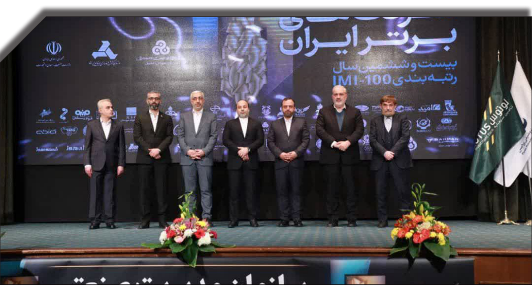
در صفحه اینستاگرام دنبال کنید: