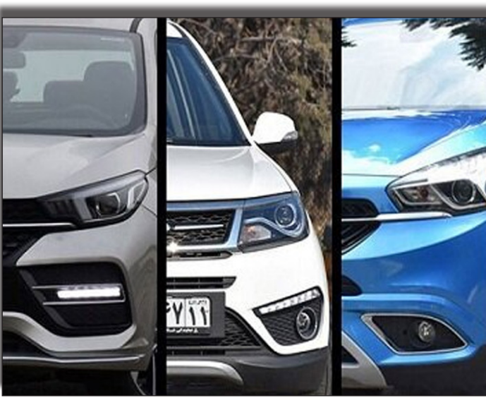
در ساید رولنامه بخوبید:

سیاست گذاری در بازار خودروهای خارجی به گونه است که از چاله فرانسوی های قدیمی به چینی های بی کیفیت افتاده ایم