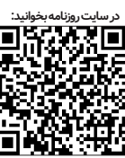
دریافت رزومه بخوانید

صادراتی و جذب سرمایه گذاری خارجی از دیگر برنامه های مدنظر است و این امید وجود دارد با دعوت حدود ۳۰۰۰ تاجر خارجی از بیش از ۱۰۰ کشور دنیا بتوان یک برنامه عملیاتی و ثمر بخش را اجرا نمود.