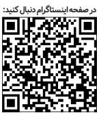
در صفحه اینستاگرام دنبال کنید

گزارش شد که با حضور به موقع آتش نشانان به خوبی اطفا حریق انجام گرفت. باید بپیماران به جای دیگری منتقل می شدند که همگی با هماهنگی شبکه بهداشت منتقل شدند.