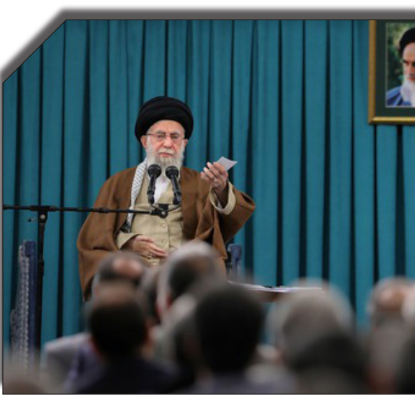
در سایت روزنامه بخت‌ناایت

ایشان در تبیین موانع موجود در فضای کسب و کار در درون دولت، به مشکلاتی نظیر مراکز متعدد تصمیم‌گیری، تعارض تصمیم‌گیری در بخش‌های مختلف دولتی و طول کشیدن بی‌منطق