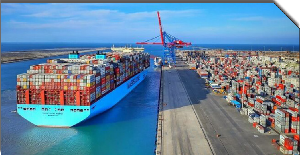
صادرات روزانه بخوابند: