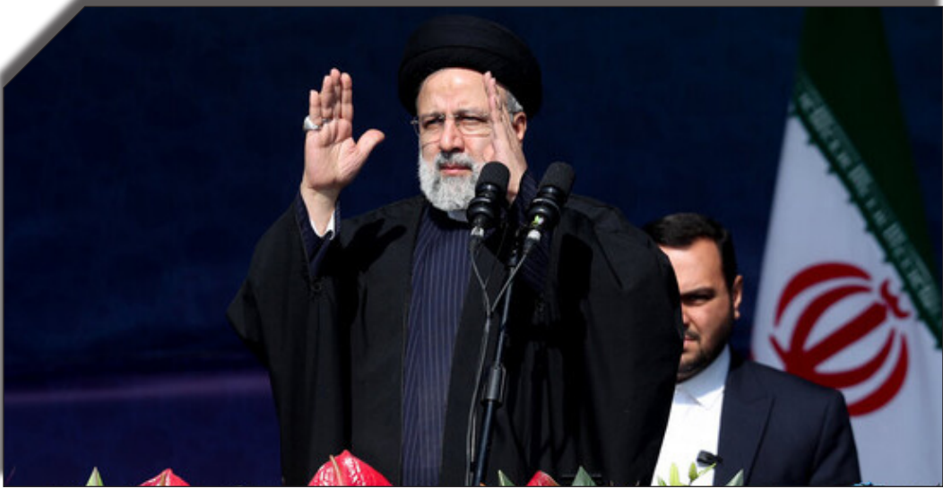
در دست روزنامه بخوانید: