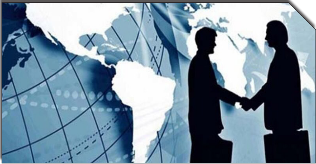
درصاف روزانه بخوانید: