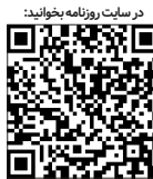
در سایت روزنامه بفرمایید:

در این میان، استان مازندران یکی از استان های کشور با ویژگی های منحصر به فردی است که پتانسیل فوق العاده زیادی برای جذب گردشگران داخلی و خارجی دارد. استان مازندران با دارا بودن ۲۲ شهرستان، در کنار چهار کشور مجاور دریای خزر به نام‌های ترکمنستان، قزاقستان، روسیه و جمهوری آذربایجان قرار گرفته است. امکان حمل و نقل دریایی با کشورهای همسایه از طریق منطقه ویژه اقتصادی بندر امیرآباد، بندر فریدون‌کنار و بندر نوشهر و پایانه و سکوی نفتی به‌شهر در شرق مازندران، اتصال آن به راه‌آهن سراسری ایران، وجود فرودگاه‌های بین‌المللی نظیر فرودگاه بین‌المللی دشت ناز ساری، نوشهر و رامسر،