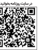
در سایت روزنامه بخوانید

نقطه عطف عقاید سه قانونی است به نام « قانون بازارها » یا « قانون سه » که محور اصلی نظریه تعادل اشتغال کامل کلاسیکها محسوب می‌شود. براساس این قانون، عرضه، تقاضای خود را به‌وجود می‌آورد. بنابراین تولید اضافی (مازاد عرضه) در اقتصاد سرمایه‌داری ناممکن است. قانون بازارها " یا "قانون سه" نقطه عطف عقاید ژان باتیست سه است و محور اصلی نظریه تعادل اشتغال کامل کلاسیکها محسوب می‌شود. مفهوم این