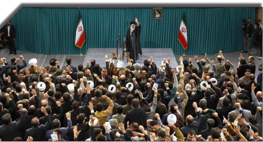
در سایت روزنامه‌خوبند:

اختلاف‌های سلیقه‌ای و سیاسی نباید در وحدت ملی ایران در مقابل دشمنان تأثیرگذار باشد.