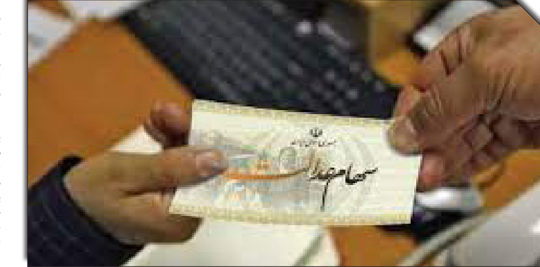
دریافت روزنامه‌های سهام

عصراقتصاد: طبق اطلاعیه سازمان بورس، وراث متوفیان سهام عدالت از طریق شعب ۴ بانک و دفاتر ۴۴ کارگزاری منتخب در سراسر کشور می توانند انتقال سریع و رایگان اصل و سود سهام عدالت متوفیان را تا قبل از روز ۱۰ اسفند ماه سال جاری انجام دهند تا سود این سهام را تا پایان اسمال دریافت کنند.