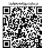
در دست‌روزمه بپوشانید

زمانی که کفایت اقتصادی خانواده پایین می‌آید دخالت‌ها بیشتر می‌شود و این از استقلال زوج‌ها کم می‌کند. کمک خانواده‌ها باید به نحوی باشد که استقلال فرزندان را کم نکند و در مقابل فرزندان باید قدر شناس باشند و این کمک را وظیفه تلقی نکنند. عامل دیگری که از طرف خانواده‌ها در طلاق موثر است وابستگی فرزندان به والدین می‌باشد. پژوهش‌ها نشان داده اینکه یکی از زوجین وابستگی شدیدی به خانواده داشته باشد منجر به شکست زندگی می‌شود؛ پس بهتر است خانواده‌ها تلاش کنند تا این وابستگی کم شود. مسئله مهم دیگری که وجود دارد، تصویر نادرست از خانواده در ذهن زوج‌های جوان است که به دلیل کم حوصلگی و کم صبری‌شان تنش‌های کوچک تبدیل به معضل‌های بزرگ می‌شود. تصور افراد از خانواده باید تصویری مشارکتی باشد. مثلاً پژوهش‌ها نشان داده در تهران خانم‌هایی که با طلاق توافقی جدا شدند، (طلاق توافقی به این معنی است که فرد به نقطه انتحاری رسیده و برای جدایی از حق خود