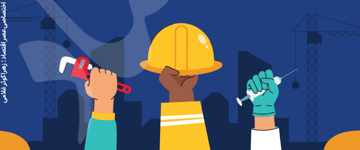
اختصاصی عصر اقتصاد: زهرآگوش غلامی