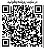
در سایت روزنامه خبوابلیت

مدیر منطقه اروپا سازمان جهانی بهداشت ضمن ارزشمند خواندن برنامه ملی سلامت خانواده در ایران، خواستار همکاری بین منطقه ای سازمان جهانی بهداشت و هانس هنری کلگ، مدیر منطقه اروپا سازمان جهانی بهداشت دیدار و گفتگو کرد. هانس هنری کلگ، مدیر منطقه اروپا