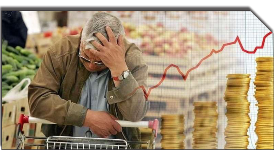
درآیند روزنامه روزانه پوینت