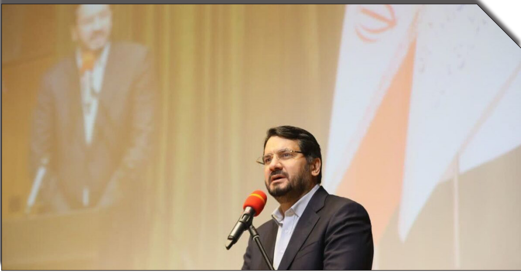
در شبانه روزانه پخش

خصوصی را در ساخت مسکن فعال تر از گذشته کنیم و مردمی سازی سرلوحه اجرای مسکن در سراسر کشور است.