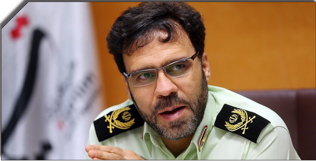
در سایت روزنامه وبلاگید.

چشم انداز درستی را به پلیس ارائه دهد. این جرم شناس پیشنهاد کرد که اطلسی از شیوه و شگرد مجرمان تهیه شده و آموزش‌ها و هشدارهای پلیس به شهروندان برای پیشگیری از وقوع یا تکرار بزه دیدگی نیز متناسب با همین اطلس ارائه شود. در این خصوص می‌توان از ظرفیت رسانه‌های محلی هم متناسب با وضعیت