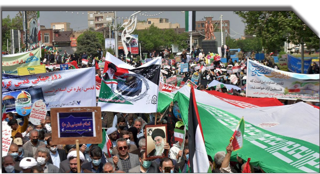
راهپیمایی روز قدس در تهران

۱۴۰۳ روز گذشته با حضور پر شور مردم آغاز شد. این مراسم در بیش از ۲۰۰۰ نقطه در کشور برگزار می‌شود. شعار راهپیمایی نیز «روز قدس، از