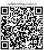
در ساعت روزانه به‌یادداشت

یادمان نرود که همین چند روز قبل ،رهبری در سخنان‌شان، به «گرانی‌ها»، «بی‌ثباتی بازار»، «تنزل ارزش پول ملی»